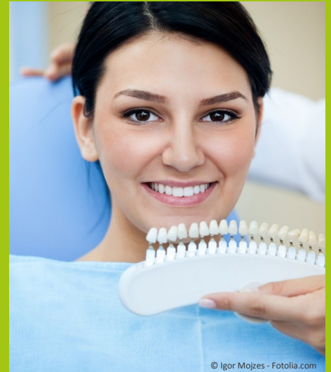
Bleaching vom Zahnarzt: Gewinnendes Lächeln mit strahlend weißen Zähnen

Dunkle Zähne können ein ziemliches Ärgernis sein: Obwohl sie sauber geputzt sind, wirken sie einfach nicht hell. Die Folge ist: Man traut sich oft nicht mehr, unbefangen zu reden und zu lächeln. Man achtet darauf, dass andere die Zähne nicht sehen. Und wenn man fotografiert wird, lässt man den Mund lieber zu. Das muss nicht sein: Zähne können heute mit bewährten Methoden wieder aufgehellt werden. Professionelles Bleaching beim Zahnarzt kostet nur wenige Hundert Euro. Aber das neue Lebensgefühl ist unbezahlbar!