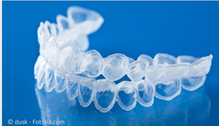
Bleaching-Form aus Kunststoff, in die Sie das Aufhellungs-Gel einfüllen.

Beim Home-Bleaching werden vom Zahnarzt dünne flexible Formen aus einem transparenten Kunststoff hergestellt, die genau auf Ihre Zähne passen (siehe Foto).