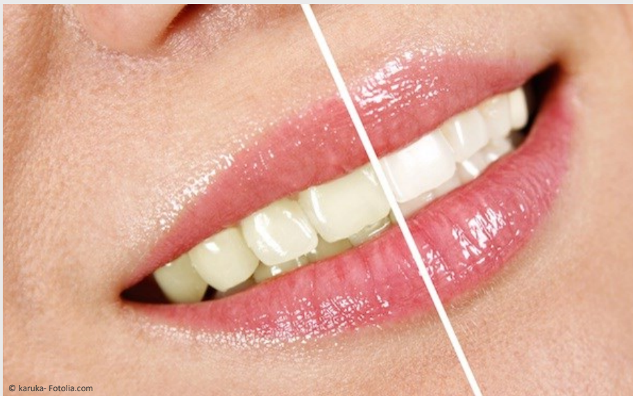
Deutlicher Unterschied: Professionelles Bleaching beim Zahnarzt wirkt!

Vertrauen Sie Ihre Zähne besser Profis an!