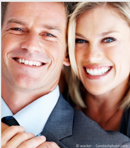
Selbstsicher mit gepflegten Zähnen

Dann werden Mund, Zähne und Zahnfleisch untersucht. Die Zahnbeläge werden angefärbt, um sie besser sichtbar zu machen und es wird die Tiefe der Zahnfleischtaschen gemessen.