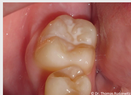
Schutz vor Karies: Versiegelung der feinen Grübchen auf der Kaufläche

Bei der Versiegelung werden die Fissuren mit einem hellen Kunststoff dauerhaft verschlossen, so dass an diesen Stellen keine Karies mehr entstehen kann (siehe Abb. unten).