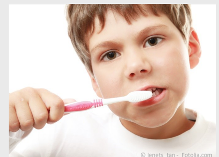
Bei der Prophylaxe lernen Ihre Kinder die richtige Zahnpflege.

Es gibt also keinen Grund, warum Sie auf Prophylaxe für Ihre Kinder verzichten sollten.